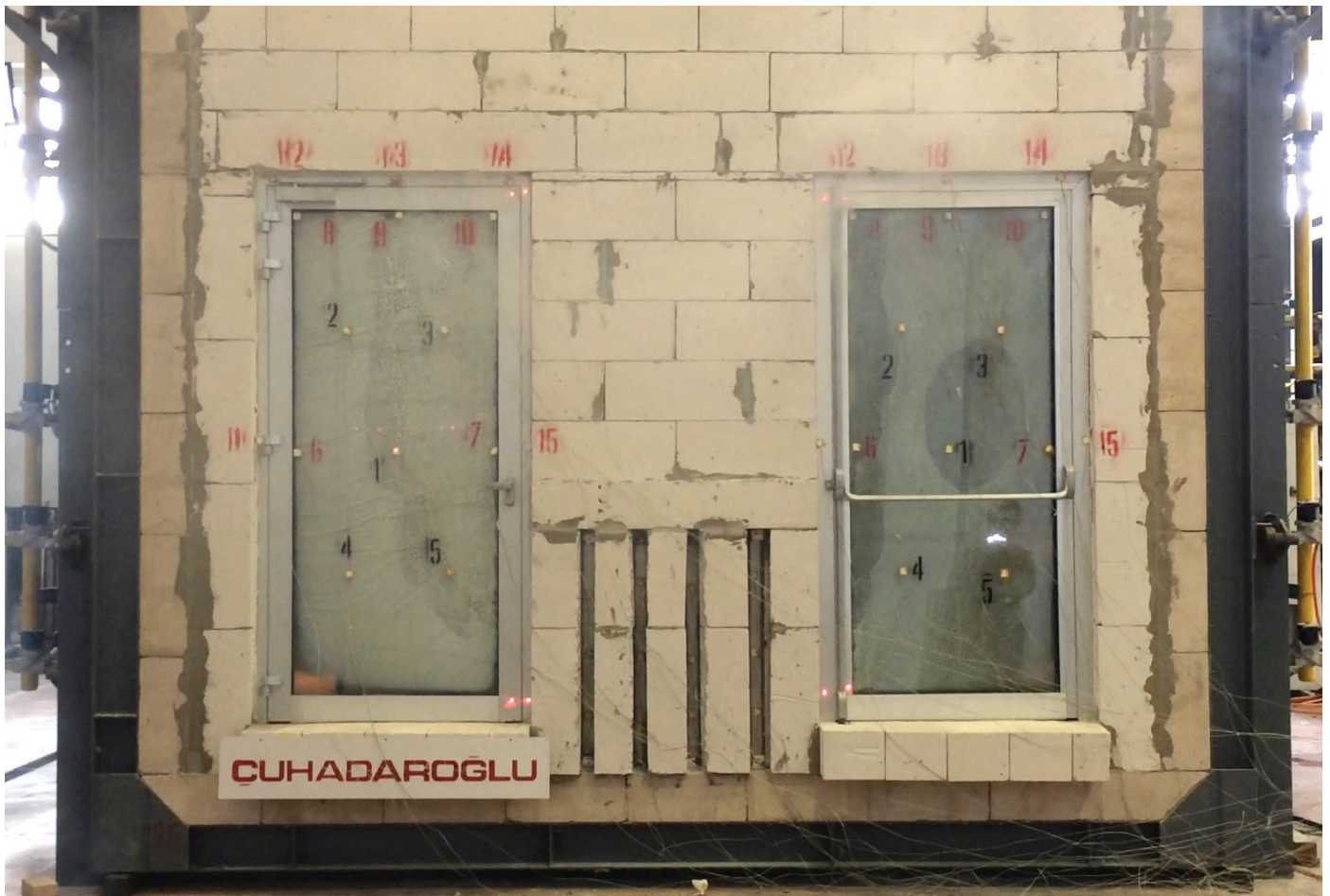
DS 92 YD Yangına Dayanımlı Camlı Kapı EI 90 Özelliği

Mevcut SL 45 HS sistem dahilinde, 90 derece dikmesiz köşe dönüşü profil ve sızdırmazlık elemanları tasarımı tamamlanmıştır.